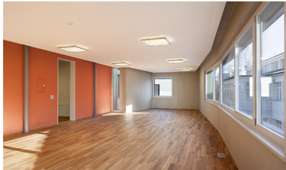
Bild oben: Büro mit Panoramafenster für 4 bis 6 Arbeitsplätze im Obergeschoss des neuen Anbaus. Die Wand gegen das best. Gebäude ist in der Komplementärfarbe des Neubaus gestrichen.

Personalaufenthalt. Neue Einbauten sind durch die Materialisierung und die Formansprache klar erkennbar.