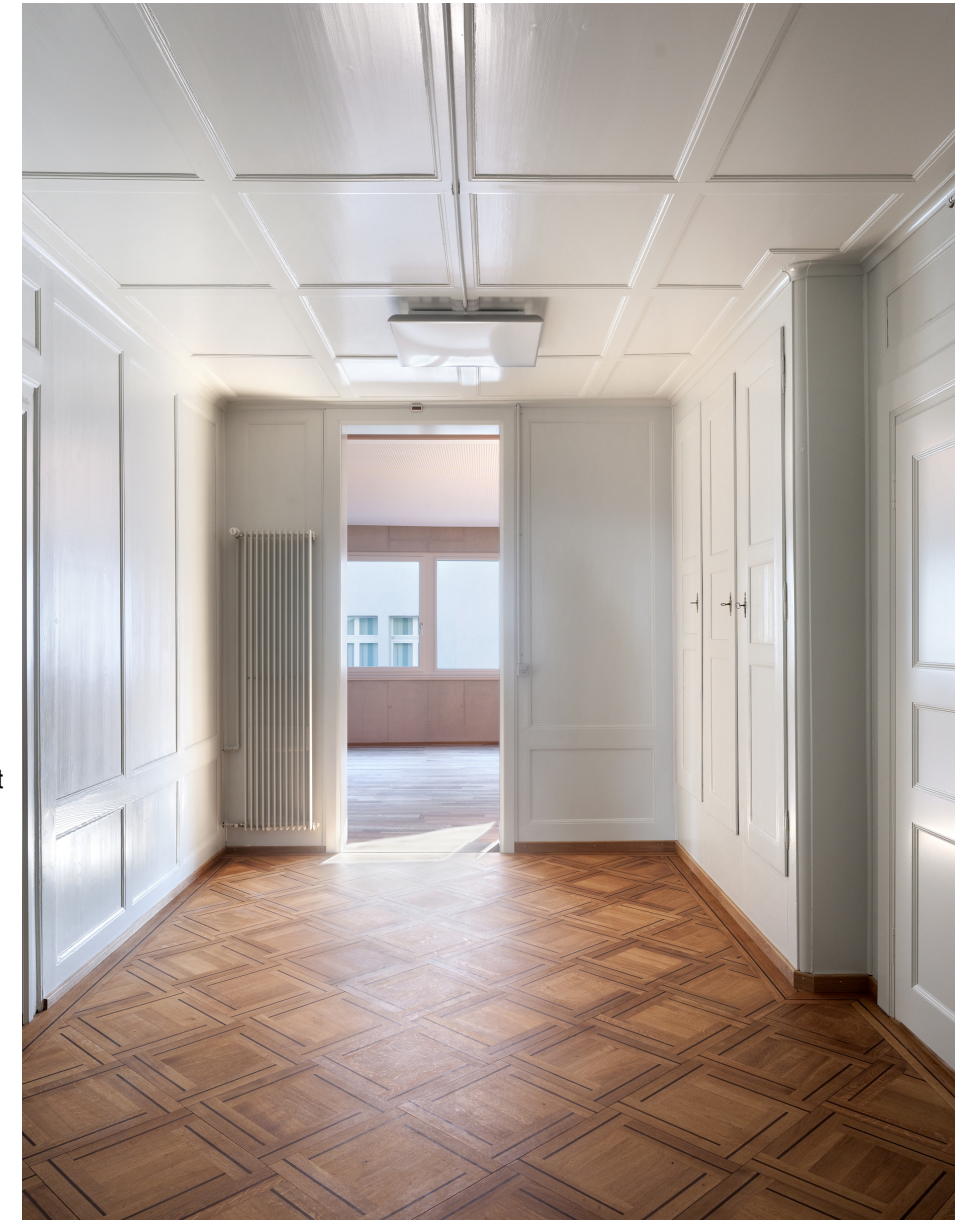
Bild oben: Gut erhaltene Innenräume des bestehenden Gebäudes werden instandgestellt.

Bild rechts: Mit dem Einbau eines Personenliftes und einem neuen, den Brandschutzvorschriften entsprechenden Treppenhaus, erfährt die vertikale Erschliessungszone den grössten Eingriff in der bestehenden Bausubstanz.