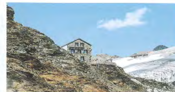
Die Mutthornhütte ist seit 2021 gesperrt.