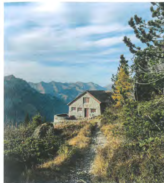
Bestehende Doldenhornhütte