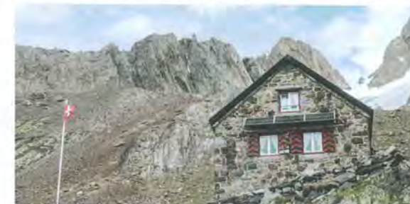
Die Triflhütte im Jahr 2017