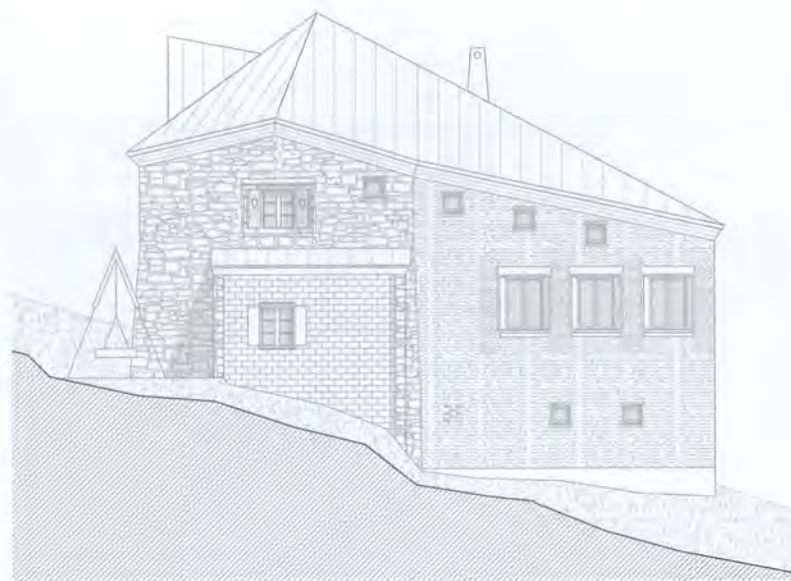
Erweiterungsprojekt für die Doldenhornhütte Nordfassade: Seiler Linhart Architekten